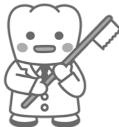
日本歯科医師会PRキャラクター よ坊さん

相談日時 ◇相談時間30分程度(先着順) ◇火・木曜日 受付時間 午後2時～4時30分 ◇土曜日 受付時間 午後1時～2時