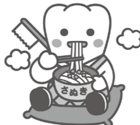
日本歯科医師会PRキャラクター よ坊さん(香川県)

お口を清潔に保つことがインフルエンザウイルスやコロナウイルス感染その予防に役立つ可能性が指摘されています。また、専門的な口腔ケアで、肺炎が大幅に減少するという研究結果もあります。このような時期には、ご自宅でもしっかりと口腔ケアをしていただくことが一層重要です。