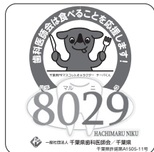
8029PRキャラクター 「もぐじい」