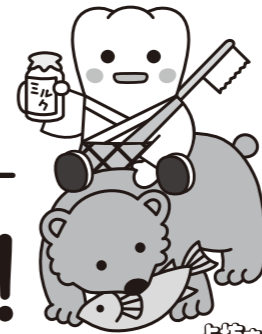
よ坊さん ご当地よ坊さん 北海道