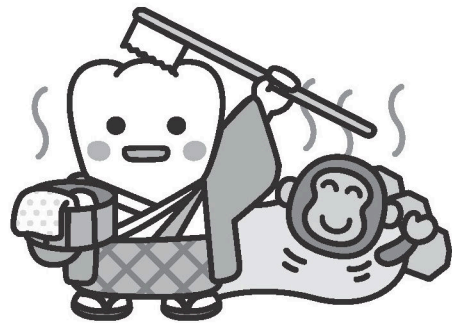
日本歯科医師会PRキャラクター よ坊さん(大分県)