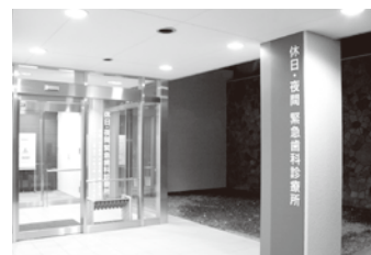
休日・夜間緊急歯科診療所

日曜、祝日・また年末年始には休日緊急歯科診療も行っています。詳しくは左記まで電話にてお問い合わせいただくか、大阪府歯科医師会のホームページをご覧ください。