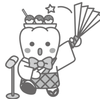
日本歯科医師会 PR キャラクター 「よ坊さん」