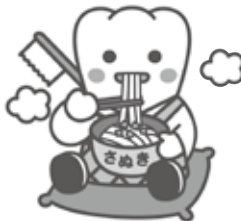
日本歯科医師会PRキャラクター よ坊さん(香川県)

オーラルフレイル(口腔虚弱)は滑舌低下、食べこぼし、わずかなむせ、噛めない食品が増えるなどのささいな口腔機能の低下から始まります。これらの様々な口の衰へは、身体の衰へ(フレイル)と大きく関わっています。かかりつけの歯医者さんで定期的にチェックしてもらうことで、「オーラルフレイル」を見逃さず、健康長寿を実現しましょう。