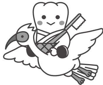
日本歯科医師会 PR キャラクター よ坊さん（新潟県）