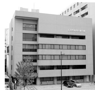
広島県歯科医師会館

が在宅歯科診療です。具体的には、必要な専門知識や技術を持った歯科医師を養成する講習会を昨年から開催し、約100人に認定証を交付。今後は在宅医療連携室を設置し、患