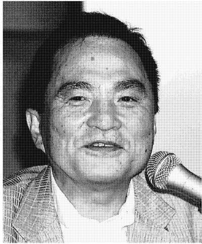
清野 裕 日本糖尿病協会理事長