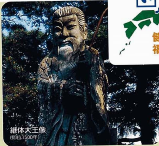
継体大王像 (即位1500年)